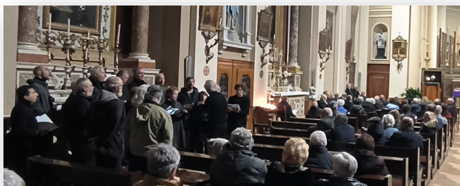
Il coro La Fonte di San Briccio

brani, eseguiti con sensibilità, rigore e maestria, tutti ispirati ai temi della sofferenza e della morte, nella vicenda umana delle ultime e drammatiche ore della vita terrena di Gesù, culminate con la sua salvifica resurrezione.