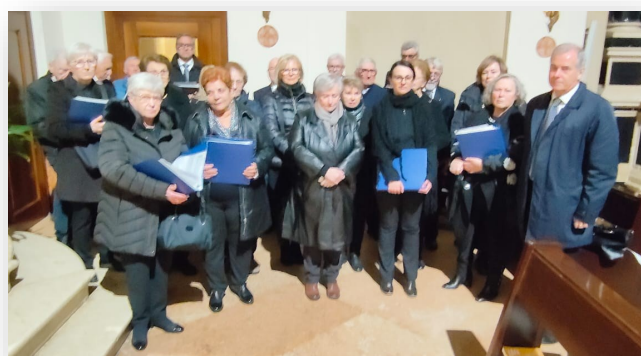
Il Gruppo Corale di S. Martino Buon Albergo