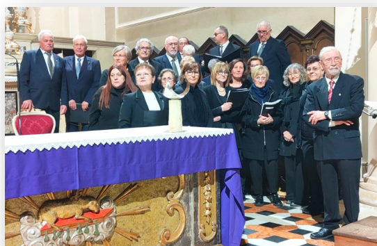
La Schola Cantorum di San Pietro di Lavagno

Il poeta ci conduce in un percorso di riflessione profonda sul mistero della Passione, invitandoci a meditare sul sacrificio di Cristo e sul suo messaggio di speranza e salvezza.