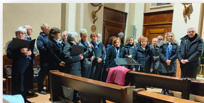
La Corale Santa Cecilia di Cadidavid

Nonostante l'evento sia già stato inscenato negli anni scorsi, ogni sua riproposizione suscita nel pubblico partecipante ed anche in questa occasione numerosi, sempre diverse e nuove occasioni di riflessione sul sacrificio patito da