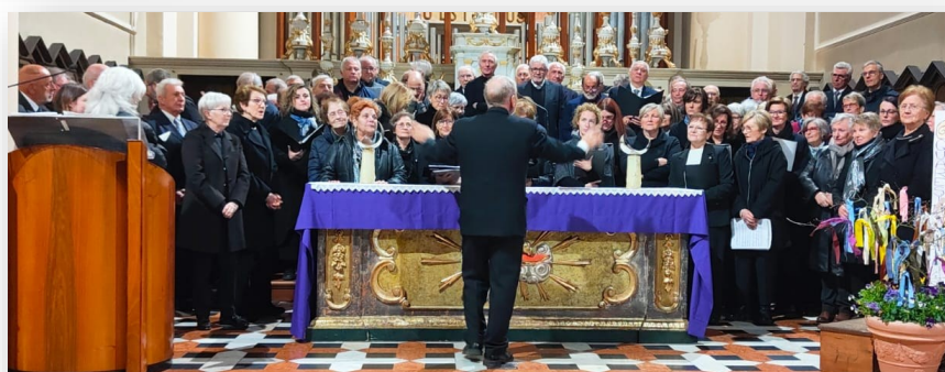
L'esecuzione finale a cori riuniti

Cristo per la redenzione dell'umanità – motivo, questo, che induce molte persone ad assistere ancora alla rappresentazione.